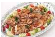
若鶏の山椒焼き Sサイズ ¥3,300 Lサイズ ¥5,500