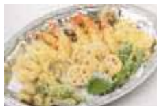
海鮮と季節野菜の天ぷら盛合せ Lサイズ ¥8,800