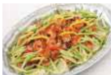
海老とアスパラガスの塩炒め バターライス添え Sサイズ ¥3,850 Lサイズ ¥6,600