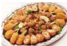
唐揚げ・カニ爪・野菜肉巻き Sサイズ ¥3,300 Lサイズ ¥6,050