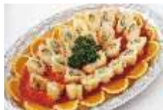
白身魚のアスパラ包み揚げ Sサイズ ¥3,850 Lサイズ ¥6,600