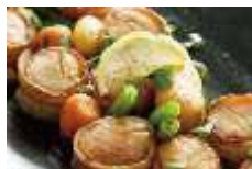
帆立のソテー 和風醤油仕立て Sサイズ ¥4,400 Lサイズ ¥7,700