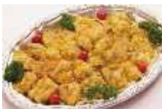
ポークピカタ バジルバスタ添え Sサイズ ¥2,750 Lサイズ ¥4,400