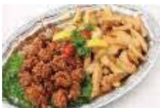
唐揚げ&フライドポテト Sサイズ ¥2,750 Lサイズ ¥4,400