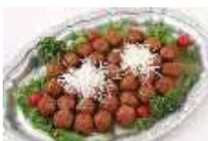
肉団子の甘酢あんかけソース Sサイズ ¥2,750 Lサイズ ¥4,400