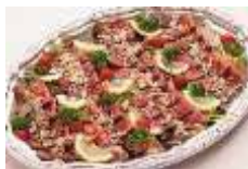
特製ローストビーフのカルパッチョ Sサイズ ¥3,850 Lサイズ ¥6,600