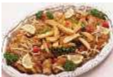
照り焼きチキン ポテト添え Sサイズ ¥2,750 Lサイズ ¥4,400