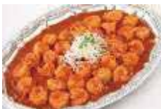
海老のチリソース Sサイズ ¥3,850 Lサイズ ¥6,600