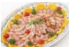
鴨肉のロースト 粒胡椒風味 Sサイズ ¥3,850 Lサイズ ¥6,600