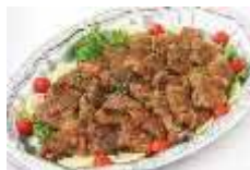
牛肉の竜田揚げ Sサイズ ¥3,850 Lサイズ ¥6,600