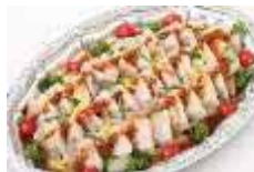
塩漬け豚肉とレタス 特製ソース Sサイズ ¥3,300 Lサイズ ¥5,500