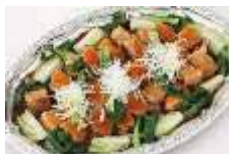
広東豚肉のやわらか煮 Sサイズ ¥3,300 Lサイズ ¥5,500