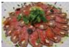
特製ローストビーフ オニオンソースorグレイビーソース Sサイズ ¥3,850 Lサイズ ¥6,600