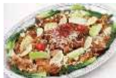
若鶏のから揚げ 甘酢ソース Sサイズ ¥3,300 Lサイズ ¥5,500