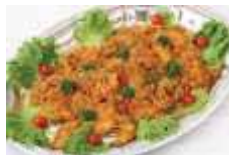
白身魚のタイ風煮込み Sサイズ ¥3,300 Lサイズ ¥5,500