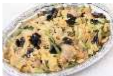
ムーシーロー (豚肉とさくらげの卵炒め) Sサイズ ¥3,300 Lサイズ ¥5,500