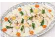
白身魚のポアレ クリームソース Sサイズ ¥3,300 Lサイズ ¥5,500

ワンウェイ容器にてお届けいたします。 メニュー内容は季節や食材の入手状況によって、予告なく変更する場合がございます。 数量の変更・キャンセルは、ご利用日の3営業日前(土日祝除く)までとなります。 期日を過ぎての変更・キャンセルは承れませんのでご了承ください。 お届け時間は11時~21時までの間1時間幅でご指定ください。(例12時~13時) 価格はすべて税込価格です。 SサイズはLサイズのおよそ半分量です。 お料理には使い捨ての紙トングを1皿につき1本お付けいたします。 その他、ご希望やご要望がございましたらご連絡ください。