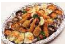
6種オードブル盛合せ Lサイズ ¥7,700