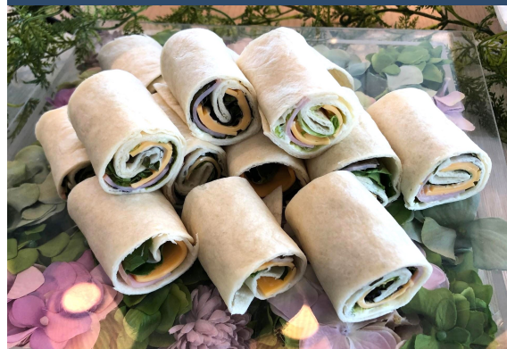
ワンハンドフード