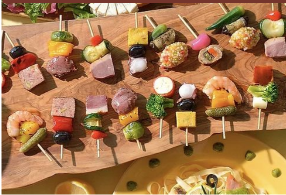
フィンガーフード